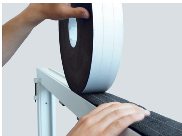
Ejemplo de instalación: ISO-BLOCO HYBRATEC

* El movimiento de elementos estructurales y los cambios de longitud temporales de las juntas deben tenerse en cuenta para dimensionar correctamente la cinta.